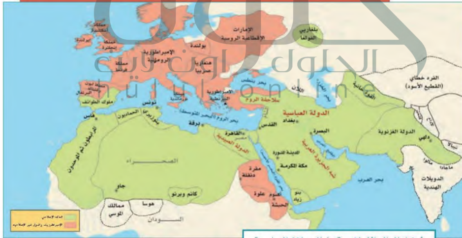
أوضاع العالم الإسلامي قبيل الحملات الصليبية

وفي مصر وبلاد الشام حلَّ الضعف بالدولة العبَّيدية، وفي الأندلس سقطت دولة بني أمية، وقامت دويلات ملوك الطوائف الضعيفة والمتنازعة. إضافة إلى ذلك كانت دويلات متعددة في جهات مختلفة من العالم الإسلامي، منغمسة في حروب داخلية.