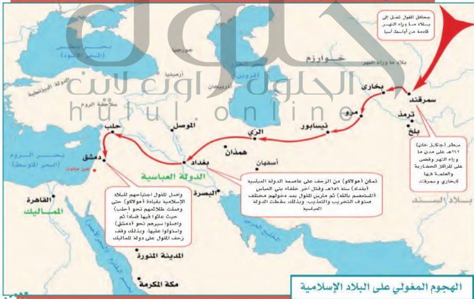
الهجوم المغولي على البلاد الإسلامية

بسبب أوضاع المسلمين المتفرقة وغير المتحدة مما جعل المغول ينجح في اجتياح البلاد الإسلامية الشرقية فقتلوا السكان وهدموا المساجد والمنازل ثم اتجهوا في زحفهم غرباً نحو بغداد عاصمة الدولة العباسية