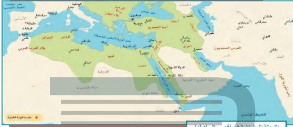
الدولة العثمانية في أقصى اتساع لها

في عهد سليم الأول (٩١٨-٩٢٦هـ) توقف المد العثماني في أوروبا، فاتجه العثمانيون إلى الاستيلاء على البلاد العربية، ويعد سليمان الأول (القانوني) (٩٢٦-٩٧٤هـ) آخر السلاطين العثمانيين الأقوياء، وصلت الدولة في عهده إلى عاصمة النمسا (فيينا)، ووضع القوانين المنظمة لشؤون الدولة؛ ولذا تُقَبُّ بالقانوني، وواصل سياسة والده فأكمل الاستيلاء على معظم البلاد العربية.